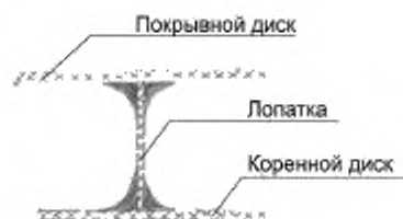
Рисунок А.6 – Крепление лопаток радиальных вентиляторов с приформовкой