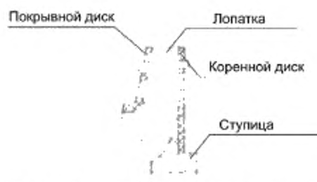
Рисунок А.7 – Крепление лопаток радиальных вентиляторов с помощью шипов