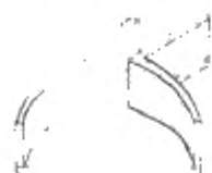
Рисунок А.2 – Сборный способ изготовления корпуса вентилятора