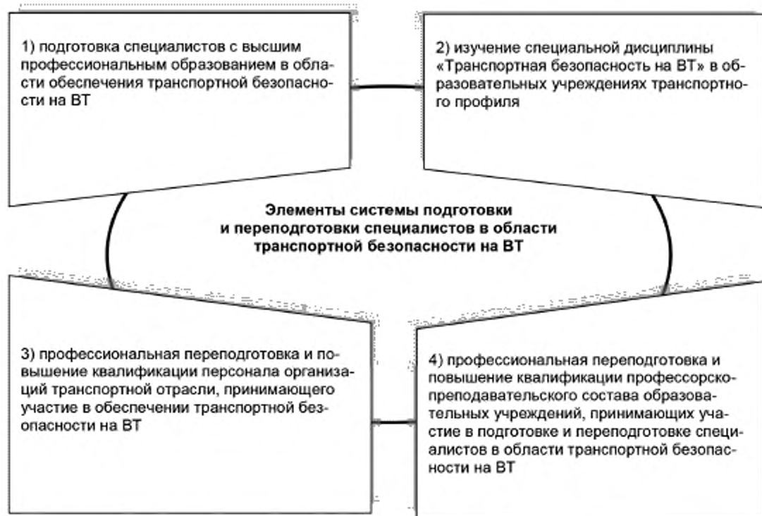
Рисунок 2 — Система подготовки и переподготовки специалистов в области обеспечения транспортной безопасности на VT в Российской Федерации (перспективная модель)

Согласно Комплексной программе обеспечения безопасности населения на транспорте, утвержденной распоряжением Правительства Российской Федерации от 30 июля 2010 г. № 1285р, создание системы профессиональной подготовки и обучения специалистов и должностных лиц в области обеспечения транспортной безопасности на VT, а также персонала, принимающего участие в обеспечении транспортной безопасности на VT, в том числе в части предотвращения и защиты от чрезвычайных ситуаций природного и техногенного характера на транспорте, является одним из приоритетных направлений обеспечения транспортной безопасности на VT в Российской Федерации.