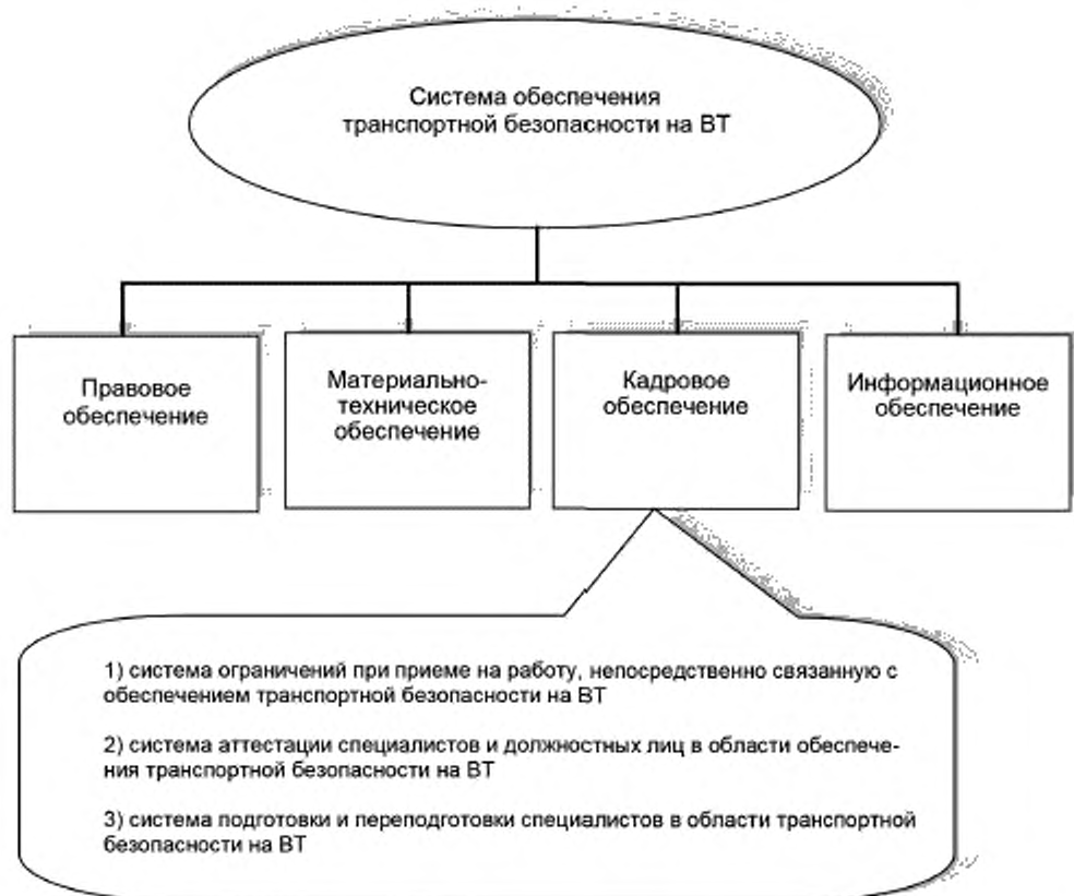
Рисунок 1 — Место кадрового обеспечения транспортной безопасности в общей системе обеспечения транспортной безопасности в Российской Федерации

Каждый из указанных элементов представляет собой подсистему определенных взаимосвязанных элементов.