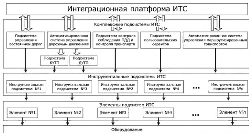
Рисунок Б.1 — Обобщенная схема физической архитектуры ЛП ИТС

Ниже представлена обобщенная физическая архитектура ИТС (см. рисунок Б.1).