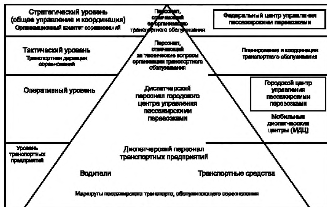
Рисунок 1 — Иерархические уровни ситуационного управления процессами транспортного обслуживания зрителей массовых спортивных мероприятий

4.3 Тактический уровень управления реализуется специально создаваемой организацией — транспортной дирекцией соревнований, на которую возлагаются технические вопросы планирования, организации и координации транспортного обслуживания, включая: