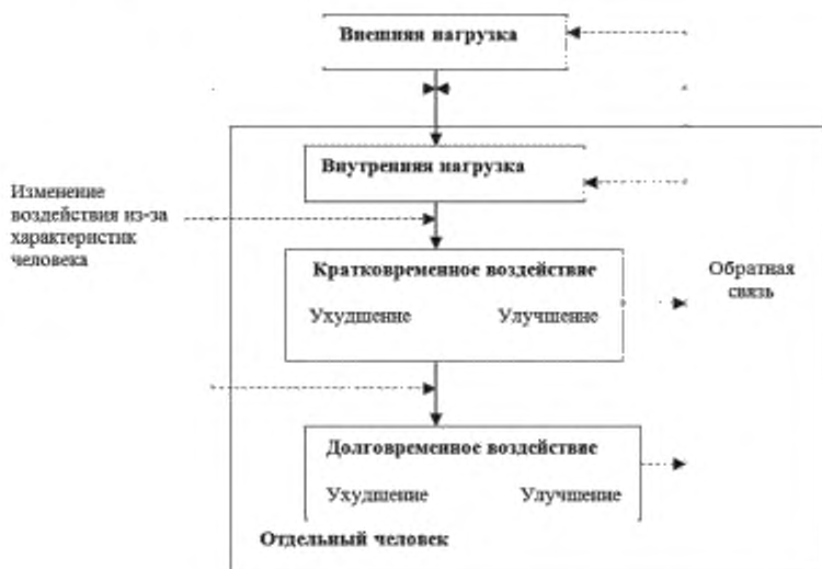
Рисунок 3 — Модель концепции воздействий нагрузки

Концептуально (см. рисунок 3) человек подвержен воздействию внешней нагрузки. Внешняя нагрузка создается факторами вне человека, обобщенными на рисунке 2 (см. также приложение Б). Эти факторы не зависят от человека, подвергаемого воздействию нагрузки. Нагрузка, которая может быть физической (например, задачи, связанные с ручной обработкой) или умственной (например, задачи по обработке информации), может быть описана в привязке к своему типу, интенсивности и временным характеристикам. Временные характеристики внешней нагрузки, такие как ее длительность или чередование работы и отдыха, имеют особую значимость, поскольку они изменяют внутреннюю нагрузку и, как следствие, воздействие на человека.