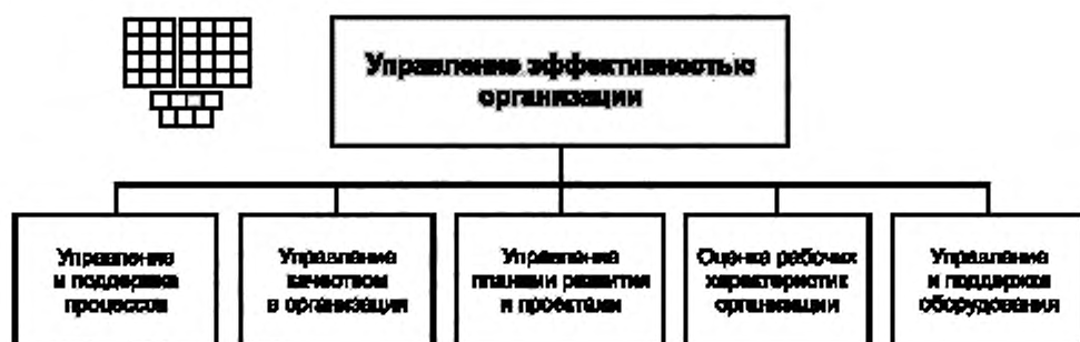
Рисунок 3 — Декомпозиция группы процессов «Управление эффективностью организации» на элементы процессов уровня 2

6.2 Процессы группы 1.3.3 предназначены для управления деятельностью организации с целью обеспечения рационального и эффективного выполнения производственных процессов.