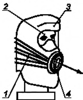
1 — система дополнительных ремней, снимающих нагрузку с капюшона; 2 — муляж головы человека, 3 — капюшон, 4 — фильтр

Одним концом динамометр закрепляют за фильтр.