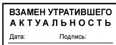
Рисунок 2 — Образец оттиска штампа «Взамен утратившего актуальность»

5.3.4 Документы, которые утратили актуальность и были заменены вновь составленными, должны иметь надпись «Заменен — недействителен». Рекомендуемый образец оттиска штампа для таких документов на бумажных носителях приведен на рисунке 3.