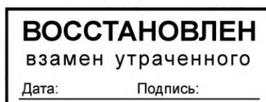
Рисунок 1 — Образец оттиска штампа «Восстановлен взамен утраченного»

5.3.2 Документы, восстановленные в связи с отсутствием или утратой, должны иметь надпись «Восстановлен взамен утраченного». Рекомендуемый образец оттиска штампа для таких документов на бумажных носителях приведен на рисунке 1.