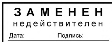
Рисунок 3 — Образец оттиска штампа «Заменен — недействителен»

5.3.4 Документы, которые утратили актуальность и были заменены вновь составленными, должны иметь надпись «Заменен — недействителен». Рекомендуемый образец оттиска штампа для таких документов на бумажных носителях приведен на рисунке 3.