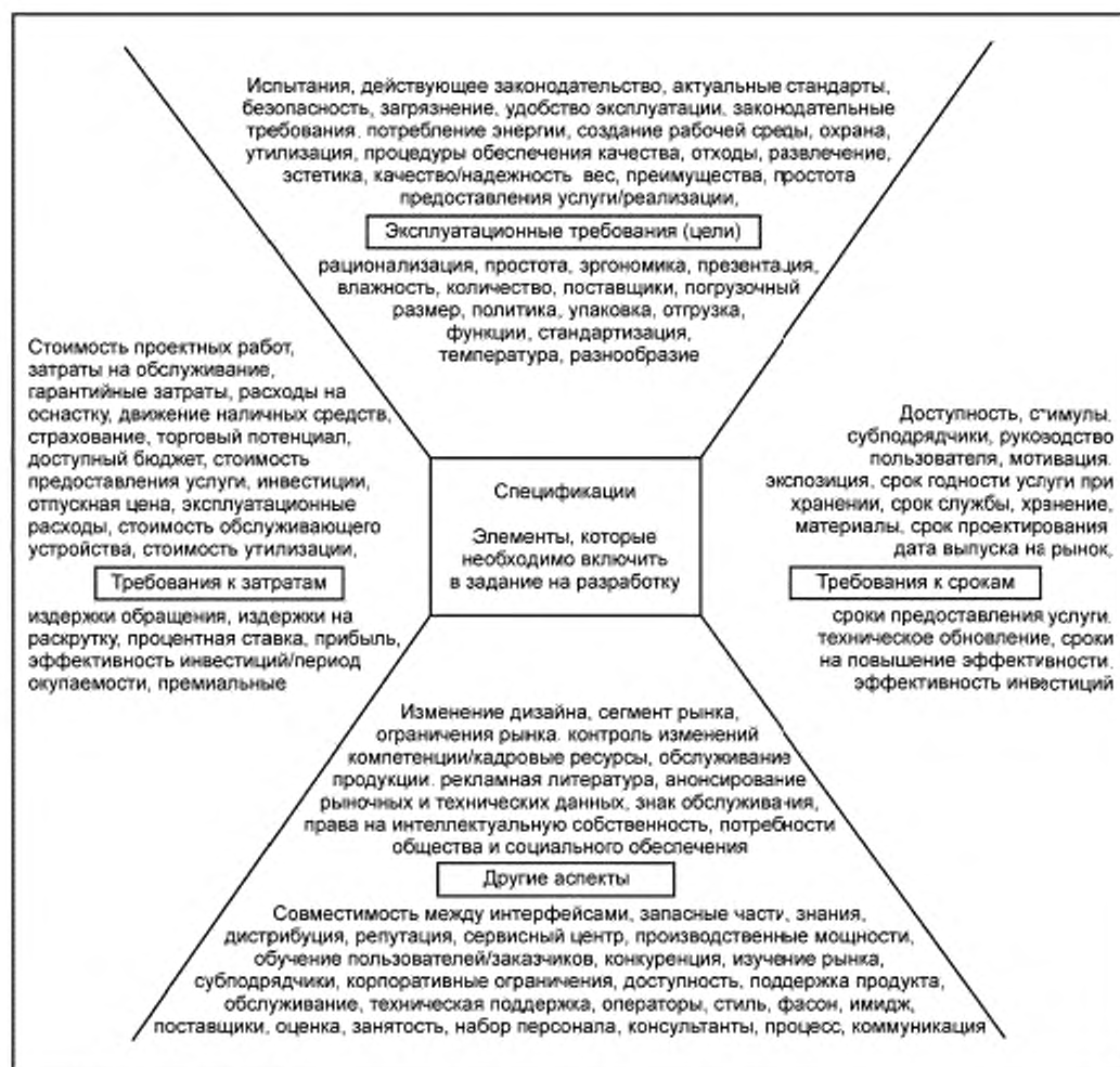
Рисунок 4 — Некоторые элементы характеристик и спецификации услуги