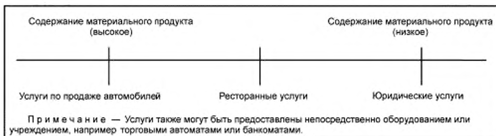
Рисунок 1 — Содержание продукта в спектре услуг

Рисунок 1 демонстрирует данную модель на примере трех типов услуг.