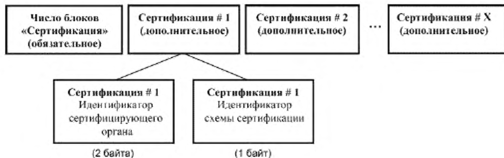
Рисунок 7 — Диаграмма записи данных о сертификации (блоки «Сертификация»)