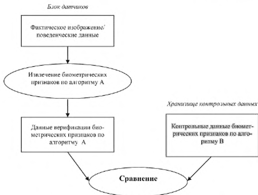
Рисунок А.2 — Использование данных биометрических признаков