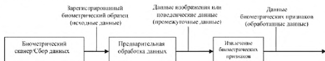
Рисунок 3 — Данные с биометрического сканера, данные изображения/поведенческие данные и данные биометрических признаков

В приложении А представлены примеры сценариев использования биометрических данных на разных уровнях обработки.