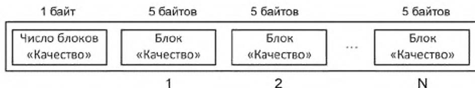
Рисунок 6 — Диаграмма записи данных о качестве (блоки «Качество»)

Блок «Заголовок представления» определяется для каждой части ISO/IEC 19794 отдельно, поэтому во многих частях ISO/IEC 19794 присутствует показатель качества, описывающий качество образца. Каждая часть ISO/IEC 19794 должна поддерживать переменное число показателей качества для представления, как показано на рисунке 6. Каждый показатель качества должен быть закодирован с использованием пятибайтового блока «Качество». Структура блока «Качество» представлена в таблице 5.