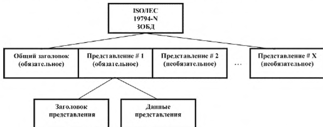
Рисунок 5 — Пример структуры ЗОБД, предусматривающей мультипредставление

Форматы, предусматривающие мультипредставление, должны иметь структуру, представленную на рисунке 5, где ЗОБД состоит из общего заголовка записи (хранение метаданных применимо для всех представлений) и одной или нескольких записей представления. Каждая запись представления состоит из заголовка (хранение метаданных представления) и биометрических данных.