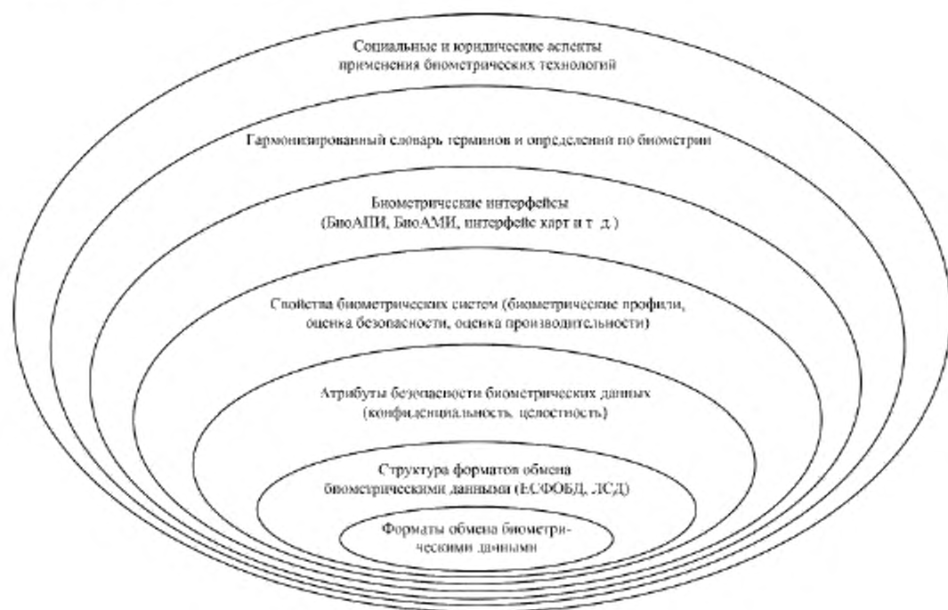
Рисунок 1 — Области стандартизации, относящиеся к биометрии 1)

Стандарты на биометрические профили регламентируют использование базовых стандартов (например, стандартов на форматы обмена биометрическими данными и биометрический программный интерфейс, а также, возможно, и стандартов небιοметрического применения) для конкретных применений. Стандарты на биометрические профили устанавливают функциональные задачи (например, контроль физического доступа сотрудников аэропорта) и требования по использованию базовых стандартов для обеспечения взаимодействия в рамках конкретной функциональной задачи.