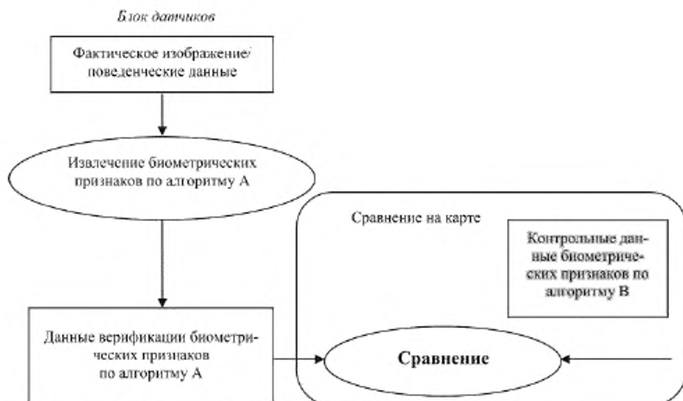
Рисунок А.3 — Использование данных биометрических признаков в сценарии сравнения на карте