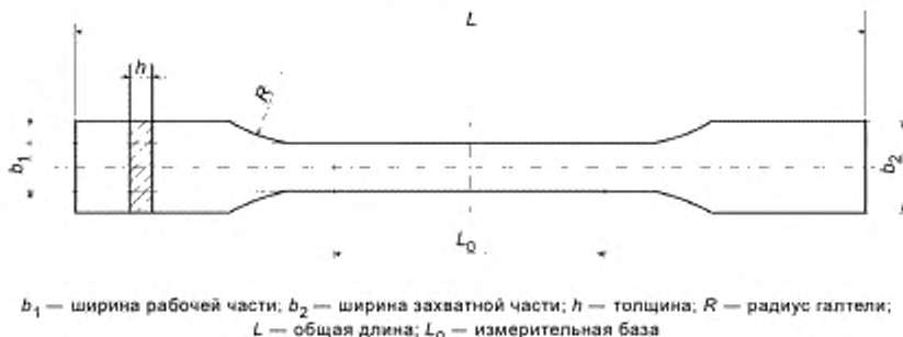
Рисунок Г.1 — Образец

Г.3.1.2 Для испытаний используют не менее 15 образцов.