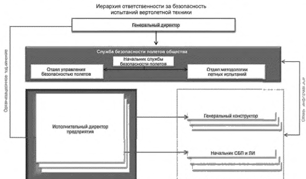
Рисунок 1 — Иерархия ответственности за безопасность испытаний вертолетной техники

Представленная схема предусматривает сбалансированное распределение обязанностей и ответственности между руководством, предприятиями, ответственными руководителями структурных подразделений и сотрудниками по вопросам обеспечения безопасности полетов.