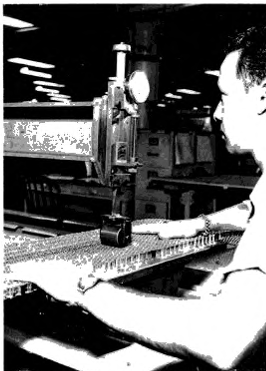
Рисунок 1 — Толщиномер роликового типа

5.2 Толщиномер дискового типа, состоящий из плоского стола с прикрепленной жесткой рамой, как показано на рисунке 2. На раме установлен диск диаметром 25 мм, имеющий вертикальный ход. Вертикальное перемещение диска передается на циферблатный индикатор с ценой деления 0,01 мм, с помощью которого регистрируют значение положительного или отрицательного отклонения от заданного номинального размера. Диск оказывает на материал внутреннего слоя «сэндвич»-конструкций нагрузку, равную 24 Н.