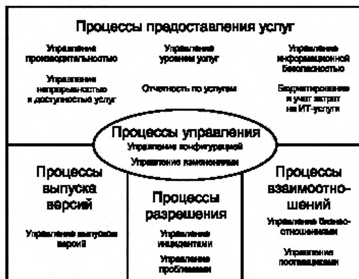
Рисунок D.1 — Процессы управления услугами ([10], рисунок 1)

Если МЕДИЦИНСКИЕ ПРИБОРЫ требуют обслуживания, ремонта, модификации и в итоге замены, то у ИТ-СЕТЕЙ возникают инциденты и проблемы, которые необходимо разрешать, а также необходимость в серьезных изменениях, требующих тщательной реализации. Есть много общего в обслуживании и МЕДИЦИНСКОГО(ИХ) ПРИБОРА(ОВ), и ИТ-СЕТИ(ЕЙ). Для сравнения на рисунке D.1, взятом из [10], показана связь между процессами предоставления услуг ИТ-СЕТЯМИ.