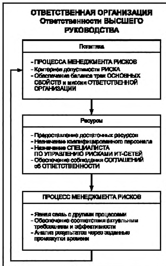
Рисунок 1 — Обязанности ВЫСШЕГО РУКОВОДСТВА

Соответствие требованиям настоящего подраздела проверяют путем экспертизы ФАЙЛА МЕНЕДЖМЕНТА РИСКОВ МЕДИЦИНСКОЙ ИТ-СЕТИ.