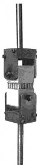
Рисунок 1 — Приспособление для нагружения для определения предела прочности на растяжение перпендикулярно к плоскости «сэндвич»-конструкций

Приспособление для нагружения должно быть самоцентрирующимся и не должно вызывать эксцентрических нагрузок. Подходящий тип приспособления для нагружения показан на рисунке 1.