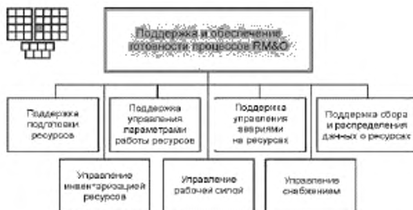
Рисунок 3 — Декомпозиция процесса 1.1.3.1 — «Поддержка и обеспечение готовности процессов RM&O» на элементы процессов уровня 3

6.2 Процесс 1.1.3.1 и его элементы процессов уровня 3 предназначены для обеспечения возможностей выполнения и готовности процессов FAB: подготовки ресурсов, управления авариями на ресурсах, управления параметрами работы ресурсов, сбора и распределения данных о ресурсах, а также для выполнения процессов управления инвентаризацией ресурсов, рабочей силой и материально-техническим снабжением.