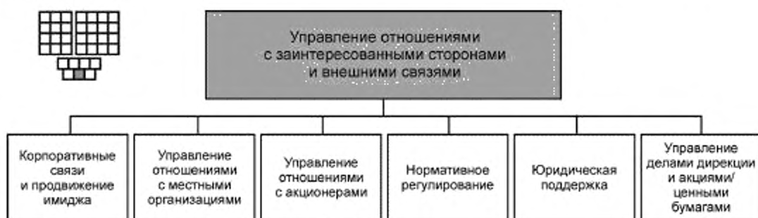
Рисунок 3 — Декомпозиция группы процессов «Управление отношениями с заинтересованными сторонами и внешними связями» на элементы процессов уровня 2

6.1 Структура группы процессов «Управление отношениями с заинтересованными сторонами и внешними связями» и соответствующие элементы процессов уровня 2 приведены на рисунке 3. На рисунке 3 представлена также пиктограмма, которая является общей для всех элементов процессов уровня 2.