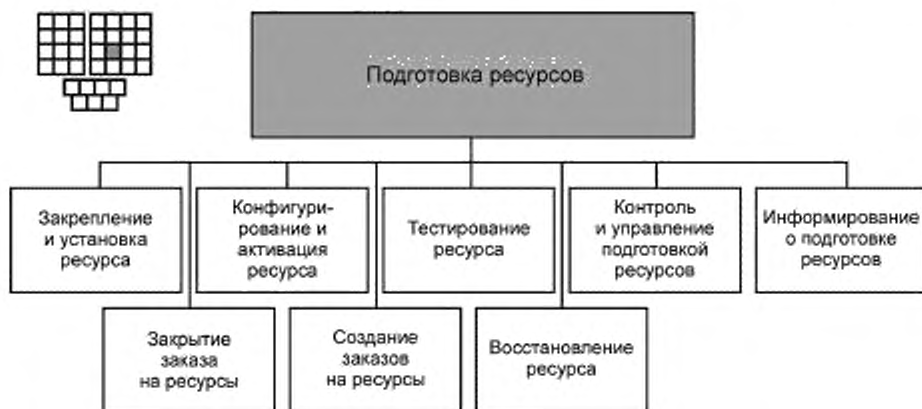
Рисунок 3 — Декомпозиция процесса 1.1.3.2 — «Подготовка ресурсов» на элементы процессов уровня 3

6.2 Процесс 1.1.3.2 и его элементы процессов уровня 3 предназначены для создания и выполнения заказов на ресурсы посредством подготовки ресурсов к оказанию услуг. Заказы на ресурсы создаются в ответ на запросы от процессов: обработки заказов на услуги, восстановления ресурсов после отказов, контроля производительности ресурсов, поставки ресурсов поставщиками/партнерами.