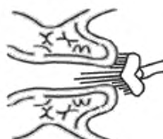
Рисунок 2 — Комбинированная щеточка, cervex-brush

Цитощетка должна быть со щетинками, расположенными под углом 90°. При заборе материала ее следует поворачивать на 90° не менее двух раз.