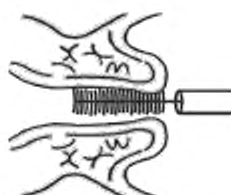
Рисунок 1 — Цитощетка или щеточка цервикальная

Материал с шейки матки забирают с помощью одноразовых щеток различного типа (см. рисунки 1—2). Для получения более информативного материала рекомендуется использовать два вида щеток cervex-brush и цитощетки различных типов.