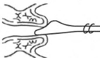
Рисунок 3 — Шпатель Эйра

Материал с влагалищной части шейки матки допустимо забирать с помощью шпателя Эйра (см. рисунок 3), а из цервикального канала — с помощью кюретки (см. рисунок 4).