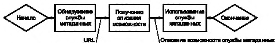
Рисунок 1 — Последовательность операций, выполняемых клиентом TV-Anytime для использования службы метаданных

Последовательность операций, выполняемых клиентом TV-Anytime для использования службы метаданных, показана на рисунке 1.