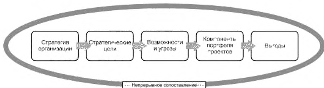
Рисунок 4 — Непрерывное сопоставление стратегии организации с планируемыми выгодами

дять не только к изменению стратегии организации, но и к обновлению структуры и плана портфеля проектов. Компоненты портфеля проектов должны обеспечивать получение выгод, связанных со стратегическими целями. Сопоставление стратегии организации с планируемыми выгодами должно осуществляться непрерывно (рисунок 4).