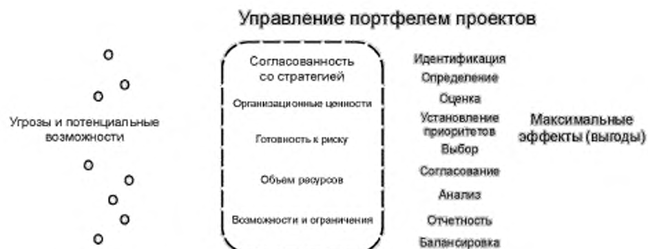
Рисунок 2 — Структура управления портфелем проектов