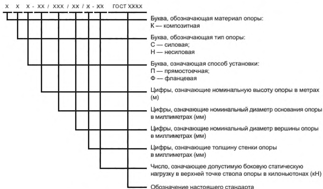
Рисунок 4.3 — Структурная схема маркировки композитных опор

4.3.3 Условное обозначение композитной опоры в технической документации и при заказе должно состоять из разделенных дефисами буквенно-цифровых групп, порядок и значения которых должны соответствовать схеме, приведенной на рисунке 4.3.