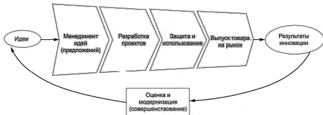
Рисунок 3 — Схематическое представление процесса инновационного менеджмента

Сотрудничество может использоваться на различных этапах инновационного процесса (см. рисунок 3). Тип сотрудничества (партнерства) может различаться в зависимости от фазы технологического процесса. Например, на поздних стадиях работ организация может не столько искать новую перспективную идею, сколько пытаться найти решение текущей технической проблемы. Именно в это время требуется доступ к новым производственным мощностям и дополнительным возможностям эффективной маркетинговой экспертизы. Другими словами, устанавливается приоритет текущих проблем, а не возможных инноваций, связанных с дополнительными рисками. Все стадии инновационного процесса являются приоритетными, как рождение самой идеи, так и ее реализация с привлечением третьих сторон в рамках совместного сотрудничества.