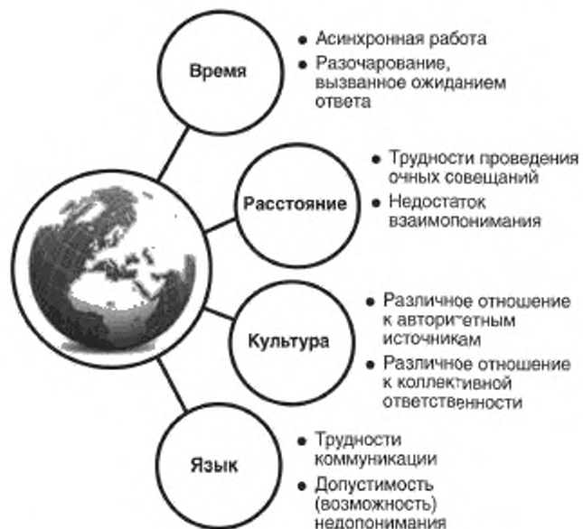
Рисунок 4 — Проблемные аспекты глобального сотрудничества

Вспомогательные инструменты сотрудничества организации также включают сетевое взаимодействие штатных сотрудников, рекомендации экспертов, совместный доступ к информации, систему поиска специальных знаний, экспертную обратную связь, взаимодействие в реальном времени. Сотрудничество способствует как синхронной, так и асинхронной коммуникации. Последнее чаще встречается при работе в разных часовых поясах.