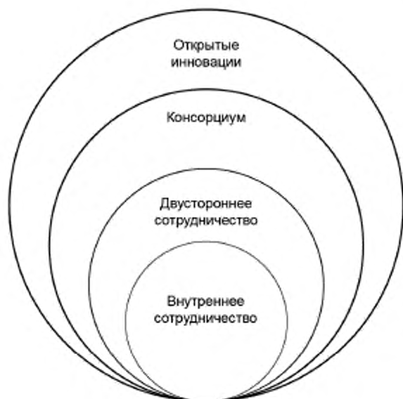
Рисунок 1 — Типы сотрудничества