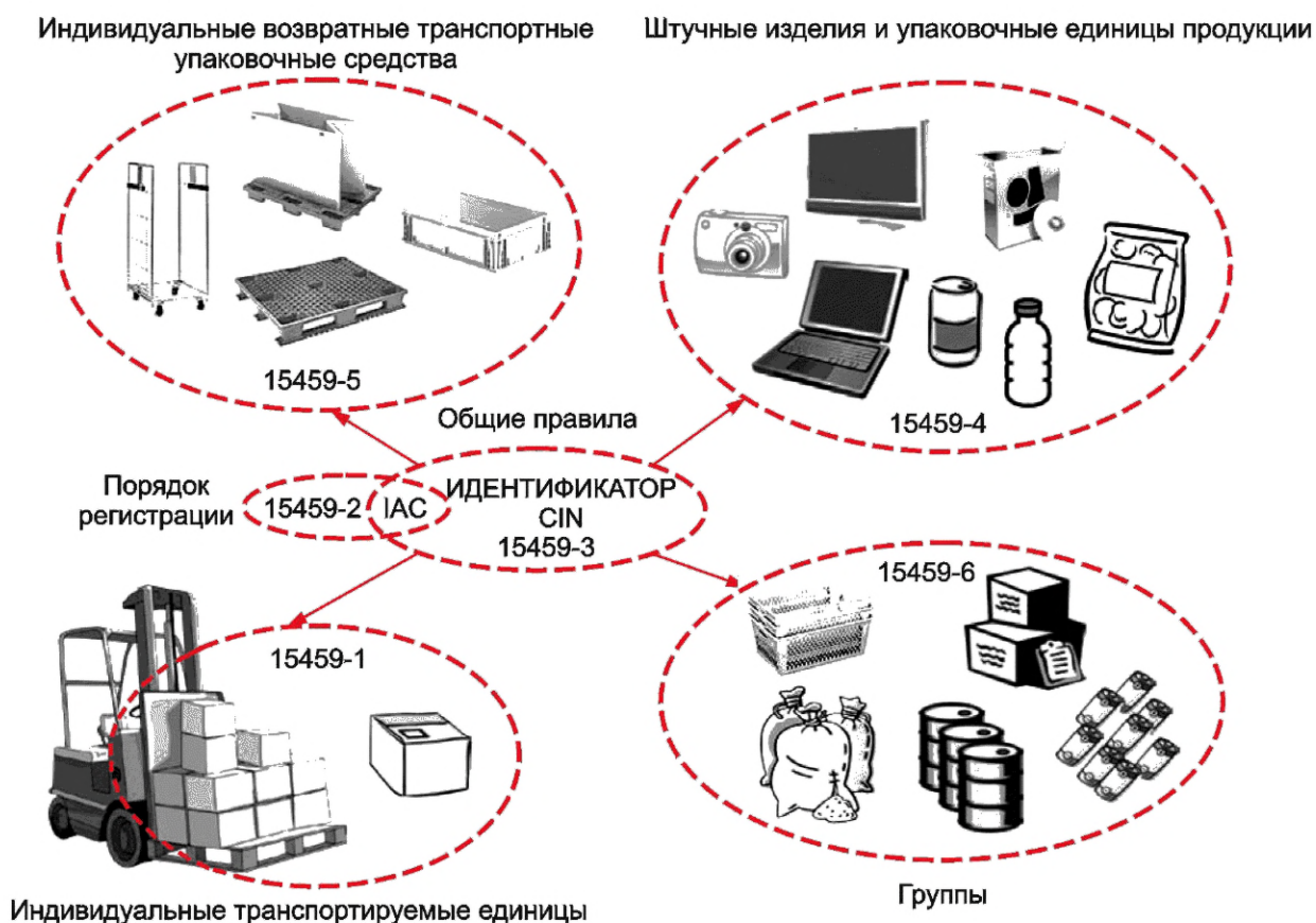
Рисунок В.1 — Общее представление взаимосвязи частей ISO/IEC 15459

На рисунке В.1 приведено общее представление различных частей, включенных в настоящий стандарт, с указанием в графическом виде различных типов объектов, подлежащих уникальной идентификации.