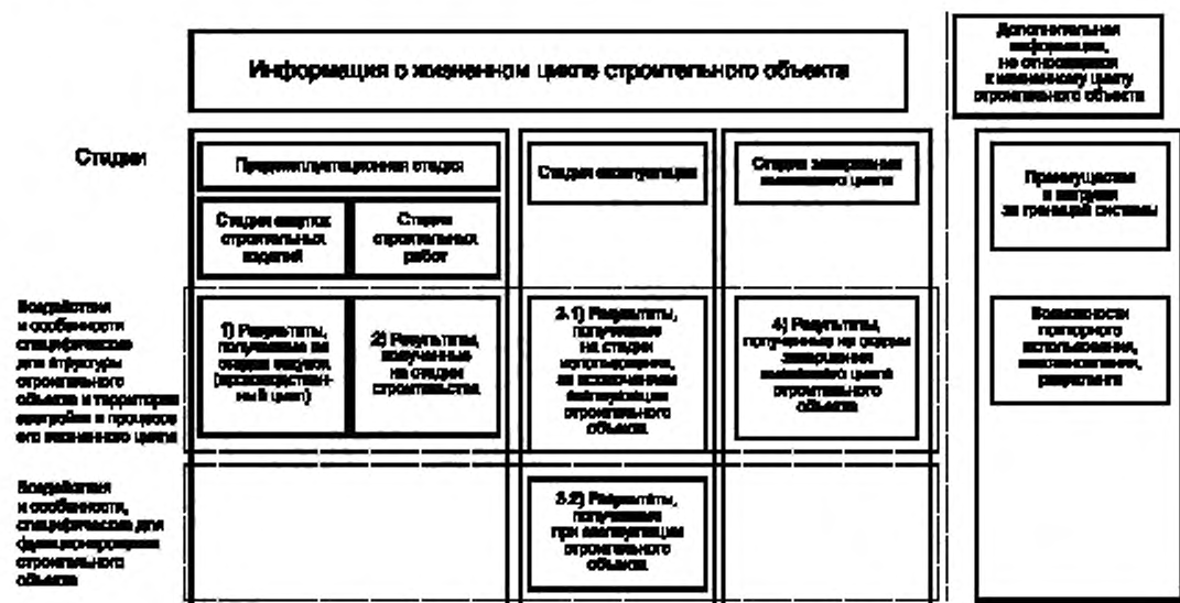
Рисунок 3 — Представление результатов определения оценки в соответствии со стадиями жизненного цикла и информационными группами

Для обеспечения того, что полученные оценки экологического показателя строительного объекта или строительной конструкции могли быть поняты и интерпретированы прозрачным и системным образом, оценки должны быть зафиксированы в соответствии с информационными группами, описанными в 5.8.2.3 и 5.8.2.4 настоящего стандарта (см. рисунок 3). Возможное объединение информационных групп, описанных в 5.8.2.3 и 5.8.2.4, должно быть четко отделено от оценки, как дополнительная информация.