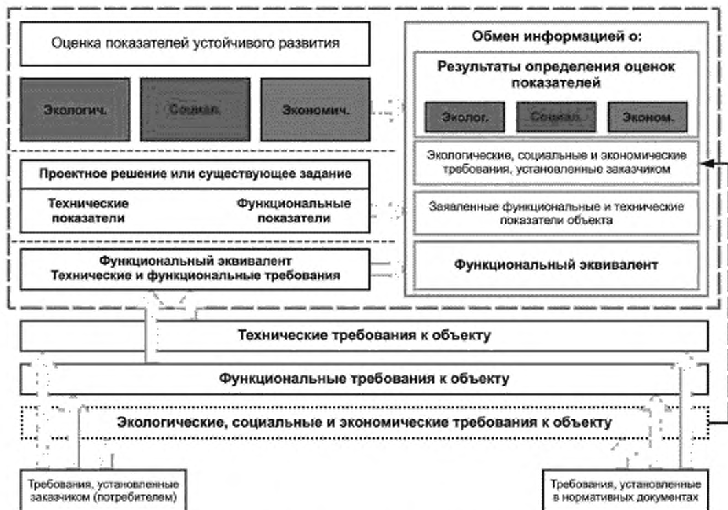
Рисунок 1 — Структура определения оценки показателей устойчивого развития строительного объекта