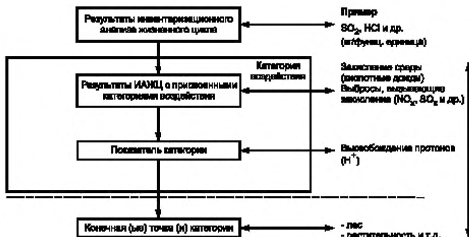
Рисунок 2 — Показатели категории

Характеристические модели отражают экологический механизм взаимодействия описанием связи между результатами ИАЖЦ, показателями категории и в ряде случаев конечной(ыми) точкой(ами) категории. Характеристическая модель использована для получения характеристических коэффициентов. Необходимые компоненты для каждой категории воздействий включают: