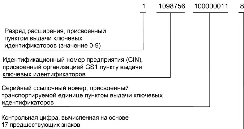
Рисунок А.1 — Строка GS1

Пример строки GS1 (18-значный серийный код транспортной упаковки — SSCC) для транспортируемых единиц приведен на рисунке А.1.