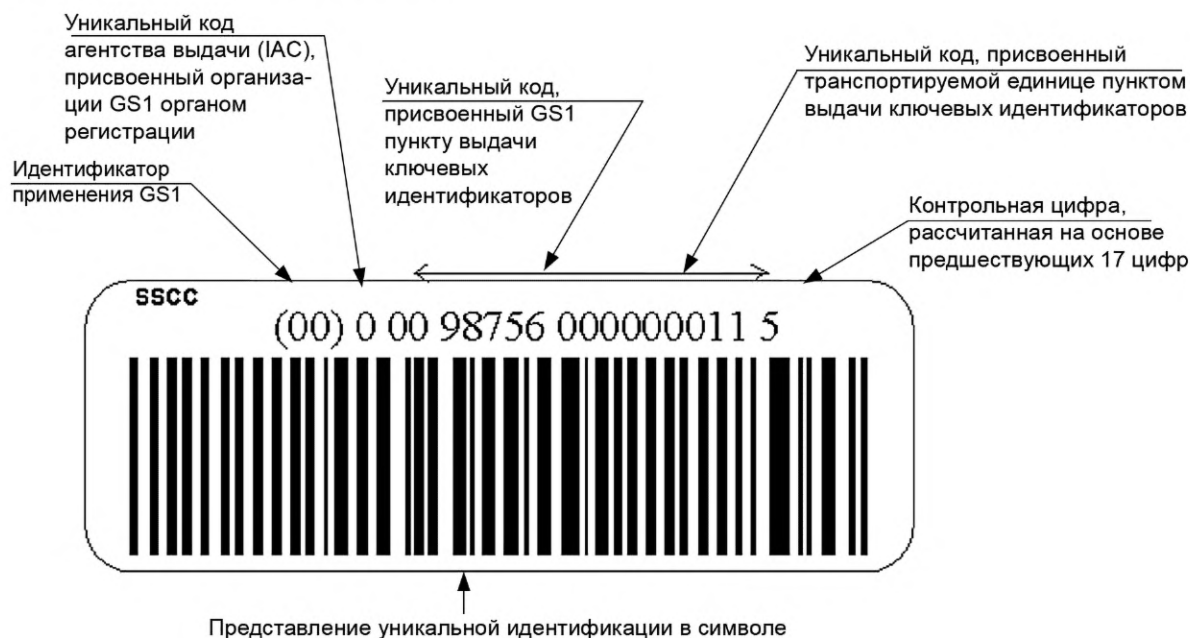
Рисунок В.1 — Представление ключевого идентификатора транспортируемых единиц в символе штрихового кода GS1-128

В соответствии с правилами международной организации GS1 строка в ключевом идентификаторе транспортируемых единиц состоит из 18 цифровых знаков, где первый знак (от 0 до 9) присваивает орган регистрации, следующие знаки организация GS1 присваивает пункту выдачи ключевых идентификаторов, а остальные — пункт выдачи ключевых идентификаторов. Последним знаком является контрольная цифра, рассчитанная на основе предшествующих 17 цифр (см. рисунок В.1).