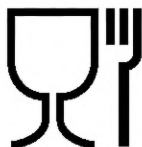
Рисунок 1 — Символ для упаковки, контактирующей с пищевой продукцией

6.2 Транспортная маркировка — по ГОСТ 14192.