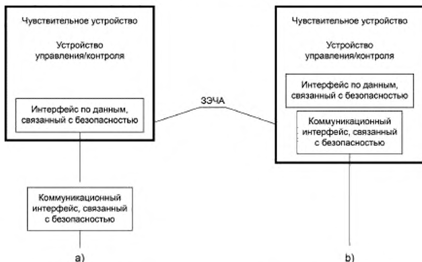
Рисунок 1 — Примеры ЗЭЧА, использующей коммуникационные интерфейсы, связанные с безопасностью

Примечание — Ввиду специфичности технологии коммуникационных интерфейсов применяют другие стандарты, отличные от IEC 61496-1. Чтобы избежать наложений на другие стандарты, функциональные требования к коммуникационному интерфейсу, связанному с безопасностью, данным стандартом не рассматриваются.