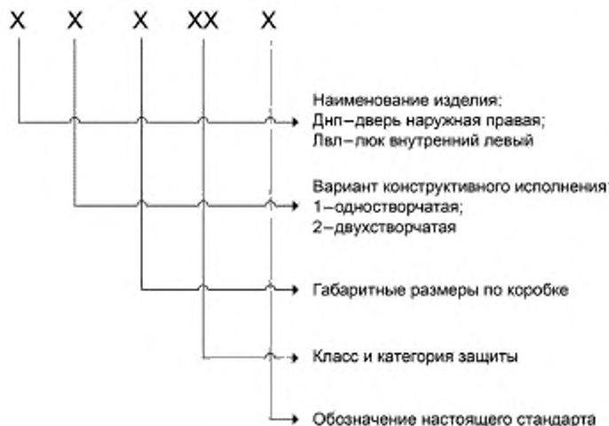
Примеры условного обозначения

4.3.2 Устанавливают следующую структуру условных обозначений ВЗК в документации при оформлении заказа.