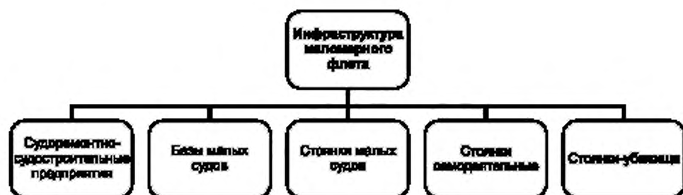
Рисунок А.3 — Функциональная схема инфраструктуры маловарного флота