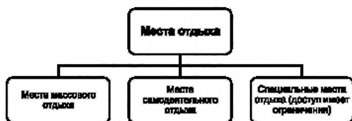
Рисунок А.5 — Виды мест отдыха