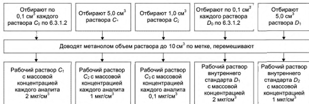
Рисунок 1 — Приготовление рабочих растворов C_1 — C_3 , D_1 , D_2

Рабочие растворы C_1 — C_3 , D_1 , D_2 готовят в мерных пробирках вместимостью 10 см 3 в соответствии с рисунком 1.