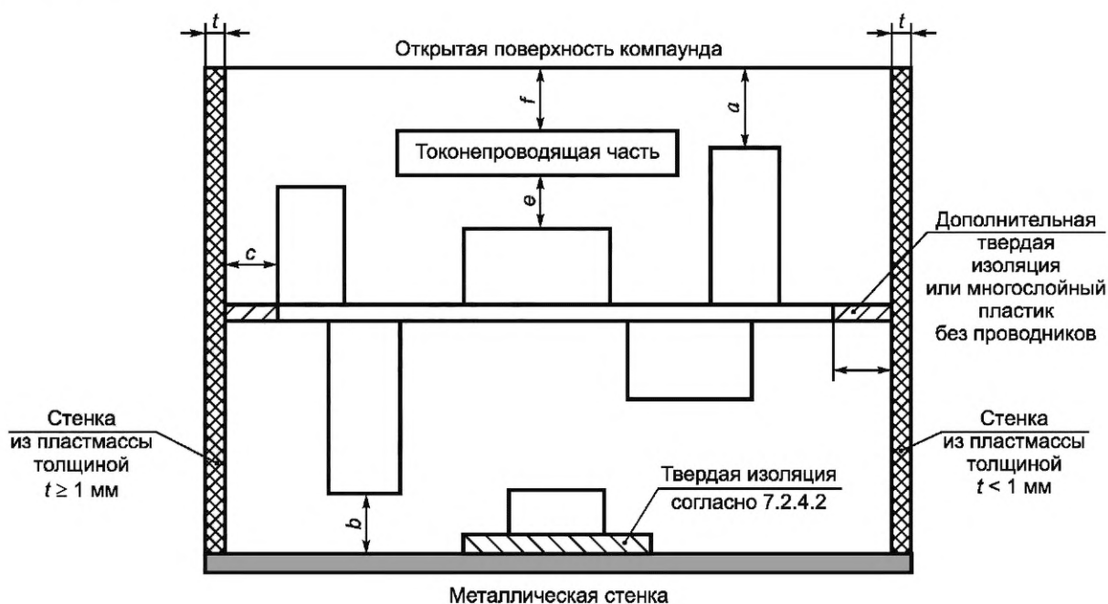
Рисунок 1 — Обозначение расстояний в компаунде

Во всех случаях компаунд должен быть испытан на электрическую прочность изоляции по 8.2.4.