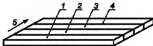
1—4 — полосы; 5 — направление изготовления

6.4 Полученный образец разрезают на четыре части перпендикулярно к направлению изготовления, как показано на рисунке 2, и выбирают полосу с наибольшим количеством сухих пятен.