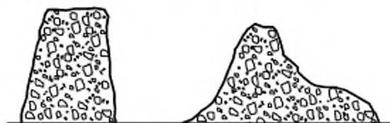
а) Равномерная осадка

Регистрируют равномерную осадку h , как показано на рисунке 1, с точностью до 10 мм.