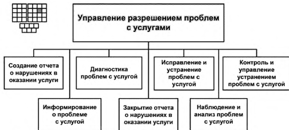
Рисунок 3 — Декомпозиция процесса 1.1.2.3 «Управление разрешением проблем с услугами» на элементы процессов уровня 3

6.1 Структура процесса 1.1.2.3 «Управление разрешением проблем с услугами» и соответствующие элементы процессов уровня 3 представлены на рисунке 3.