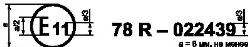
Образец А (см. 4.4 настоящих Правил)

Приведенный выше знак официального утверждения, проставленный на транспортном средстве, указывает, что этот тип транспортного средства официально утвержден в Соединенном королевстве (E 11) в отношении тормозного устройства на основании Правил ЕЭК ООН № 78 под номером официального утверждения 022439. Первые две цифры номера официального утверждения указывают, что в момент предоставления официального утверждения Правила ЕЭК ООН № 78 уже включали поправки серии 02.