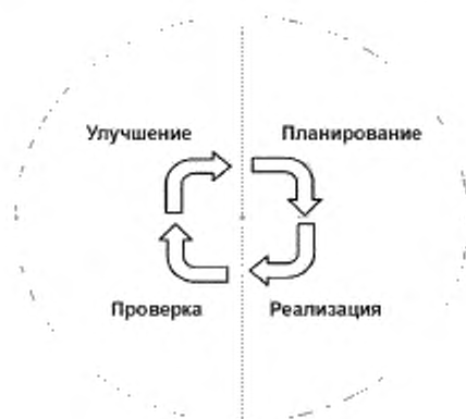
Рисунок 4 — Цикл управления ПСЦ

Управление ПСЦ осуществляется в соответствии с циклом PDCA (см. рисунок 4), включающий в себя следующие этапы: