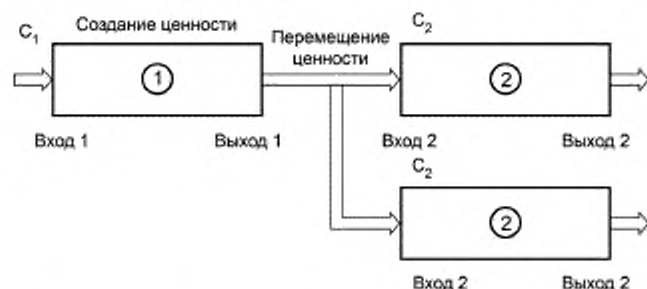
Рисунок 3 — Структура элементарного действия по созданию и перемещению ценности (последовательно-параллельные цепи)