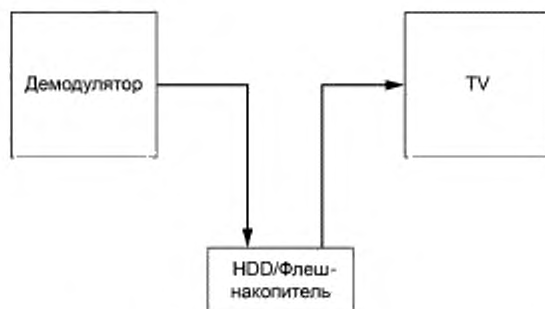
Рисунок А.2 — Запись с временной задержкой с единичным тюнером

На рисунках А.2 и А.3 показан поток данных для единичного тюнера с временной задержкой и для мультифункциональной записи и воспроизведения.