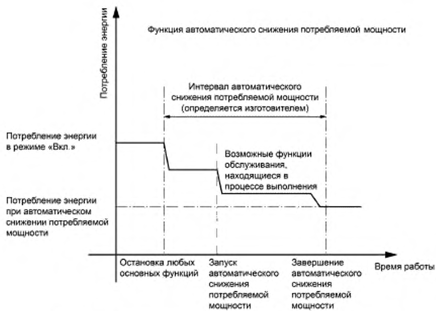
Рисунок 1 — Функция автоматического снижения потребляемой мощности