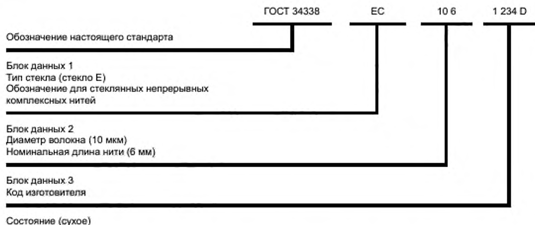
Рисунок 2 — Обозначение ГОСТ 34338-EC, 10 6, 1 234 D

2 Обозначение рубленых нитей с типом стекла E, диаметром волокна 13 мкм, номинальной длиной нити 12 мм, применяемых для прессматериалов на основе реактопластов, приведено на рисунке 3.