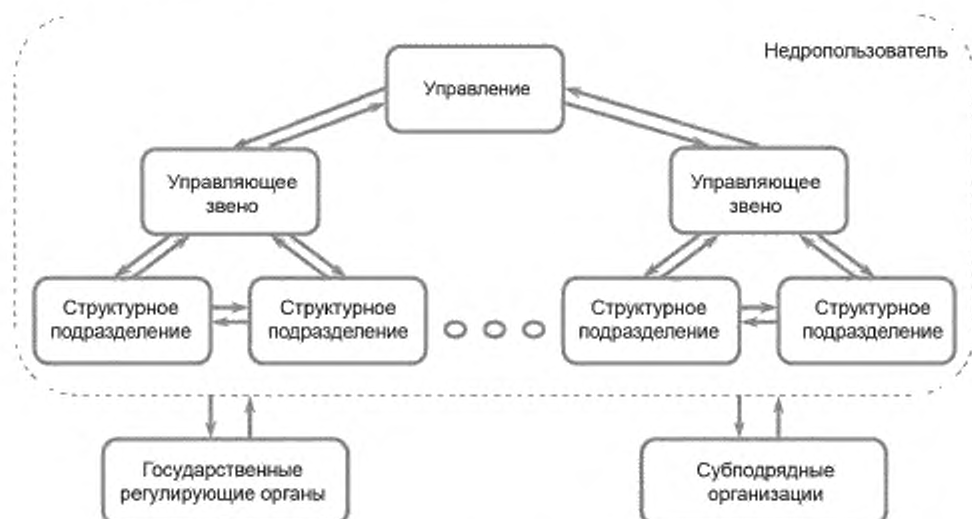
Рисунок 3 — Схема информационных потоков нефтегазового предприятия

6.1.1 На рисунке 3 представлена схема информационных потоков геолого-технологической информации нефтегазового предприятия.