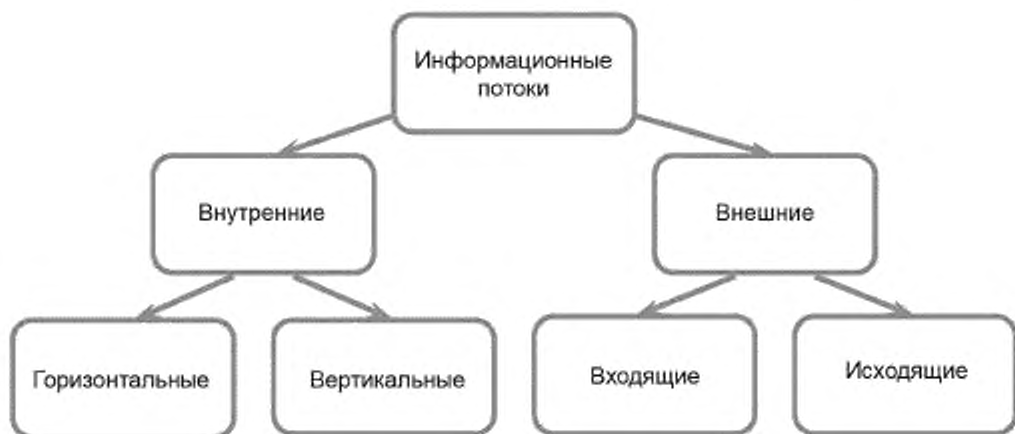
Рисунок 4 — Классификация информационных потоков

По отношению к информационной системе участника геолого-технической деятельности по добыче УВ выделяют внешние и внутренние информационные потоки в соответствии с рисунком 4.