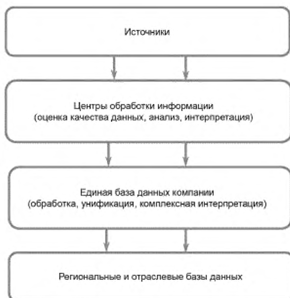
Рисунок 2 — Схема организации движения потоков геолого-технологической информации