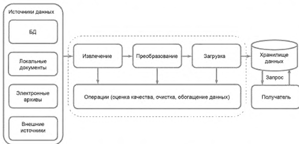
Рисунок 5 — Общая схема движения геолого-технологической информации

На рисунке 5 представлена общая схема движения геолого-технологической информации.