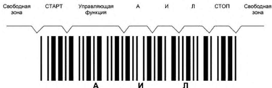
Рисунок ДА.1 — Символ штрихового кода, в котором закодированы знаки АИЛ

Служебные знаки «-», «.» при декодировании не передаются и в визуальном представлении не указываются. Символы штрихового кода, в котором закодированы знаки АИЛ, приведены на рисунке ДА.1.