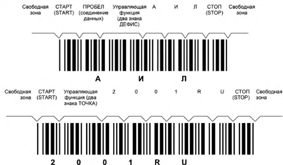
Рисунок ДА.2 — Символы штрихового кода, в которых закодированы данные АИЛ2001RU

Символы штрихового кода, в которых закодированы данные АИЛ2001RU, приведены на рисунке ДА.2.