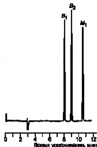
Рисунок 2 — Хроматограмма рабочего раствора смеси афлатоксинов

В инжектор хроматографа микрошприцем вводят 0,005 см 3