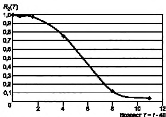
Рисунок Б.2 — Эмпирическая функция надежности R_2(T)

Для оценки среднего и минимального возраста газопровода составляют выборку по группам газопроводов, достигших возраста 40 и более лет (см. таблица Б.2):