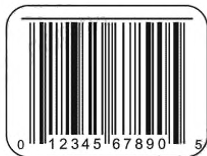
Рисунок С.1 — Линия для выявления дефектных элементов печатающей головки

Альтернативный метод обнаружения дефектных точек — печать линии вдоль символа в соответствии с рисунком С.1. Любой точечный дефект, который будет выглядеть как маленький разрыв линии, будет замечен оператору.