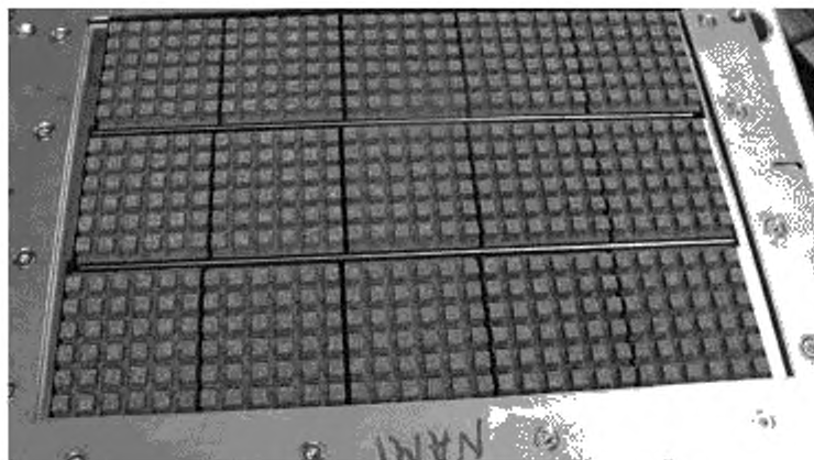
Рисунок Б.2 — Общий вид съемной площадки с рабочими плитками