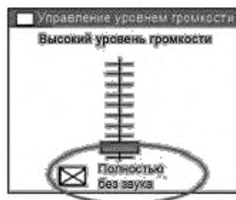
Рисунок 2 — Управление уровнем громкости

Звук должен быть установлен на минимальный уровень громкости (допустимо полное отключение звука, как показано на рисунке 2);