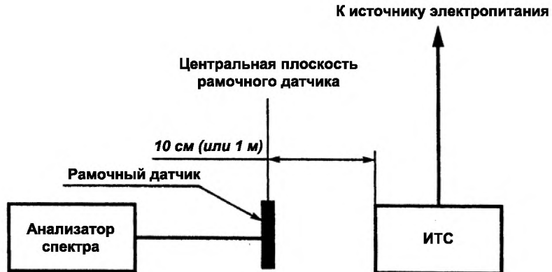
Рисунок А.2 – Испытательная установка для измерения магнитного поля, создаваемого ТС