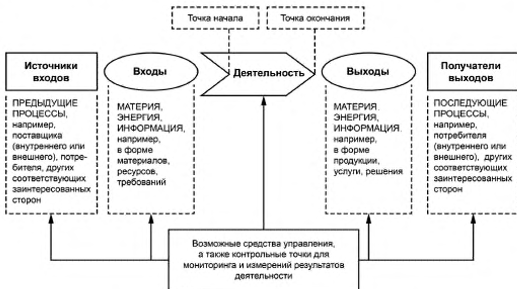
Рисунок 1 — Схематичное изображение элементов процесса

Рисунок 1 дает схематичное изображение любого процесса и иллюстрирует взаимосвязь элементов процесса. Контрольные точки мониторинга и измерения, необходимые для управления, являются специфическими для каждого процесса и будут варьироваться в зависимости от соответствующих рисков.