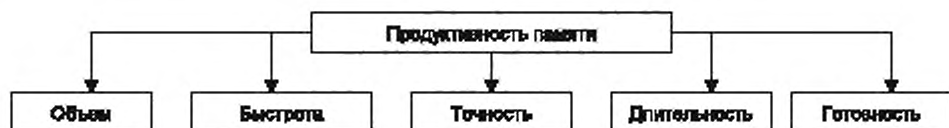
Рисунок 2 — Продуктивность памяти

4.27 Продуктивность памяти характеризуется объемом и быстротой запоминания информации, длительностью сохранения, готовностью и точностью воспроизведения (см. рисунок 2).