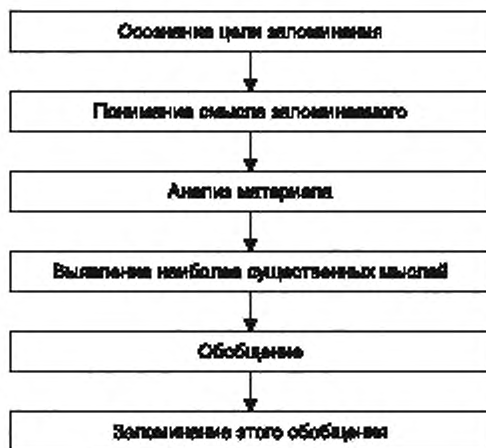
Рисунок 5 —Этапы осуществления логического запоминания

Структура этапов осуществления логического запоминания представлена на рисунке 5.