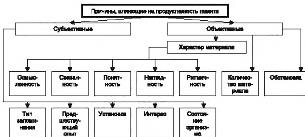
Рисунок 3 — Причины, влияющие на продуктивность памяти

Причины, влияющие на продуктивность памяти, представлены на рисунке 3.