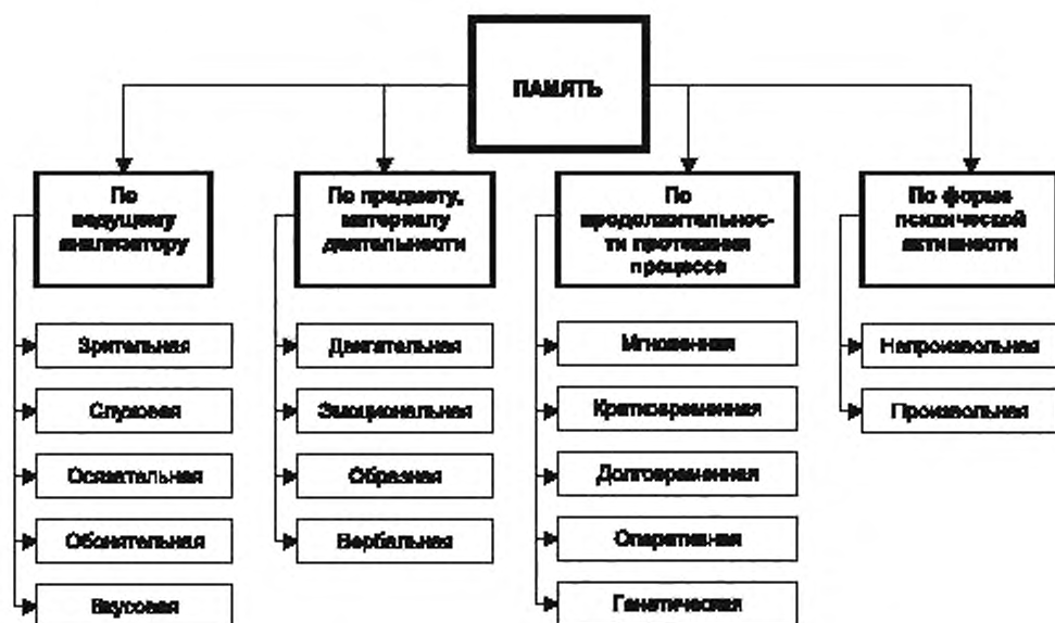
Рисунок 4 — Виды памяти в осуществлении запоминания информации

Она работает без предварительной сознательной установки на запоминание, но на последующее воспроизведение информации.